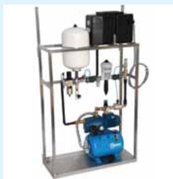
Előre összeszerelt ellátó egység (opció)